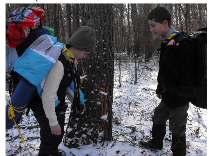
Ezen a fán a harkály dolgozott