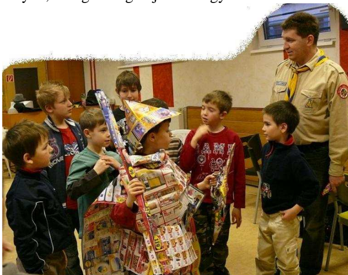
Reklám újság hasznosítás

Négy ranger törzs hét csoportja mérte össze ügyességét a különféle próbákban és játékos feladatokban. A nap végére a „hétpróbás” ranger csoportokból a Pestlőrinci lányok, az Égi lovagok jöttek ki győztesen.