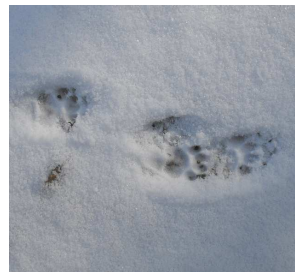
Na, vajon kik jártak erre?

A nyomokat követve hamarosan találkozunk az erdőlakókkal, mint például ezzel a muflon nyájjal