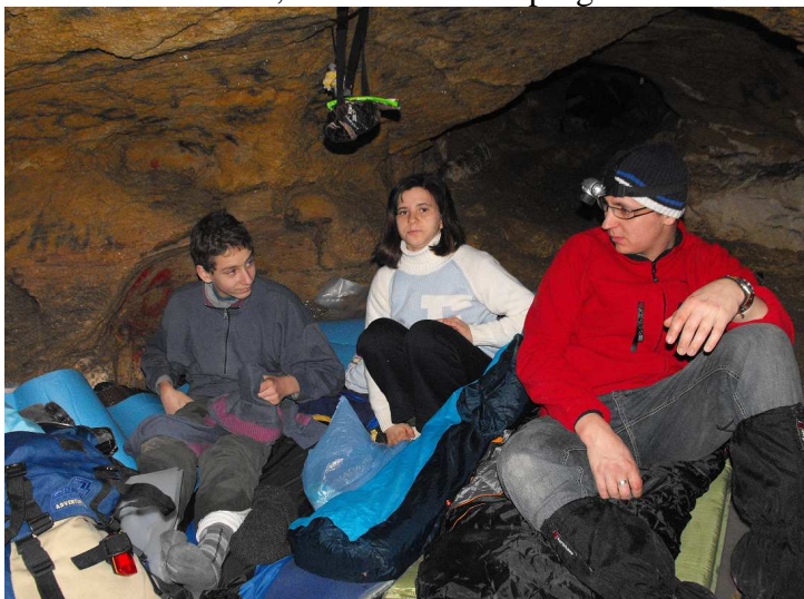
Ha én ezt a facebookon elmesélem!

Volt előszobánk, konyhánk, hálófülkénk. A fürdőszobát és a központi fűtést most kihagytuk. Hőmérőnk kint a szabadban -6 °C mutatott, odabent +1 és +5 °C között, ami egészen elviselhető, belegondolva, hogy ezen a télen vajon, hány honfitársunk kénytelen hasonlót bevállalni, nem szabadidős programként.