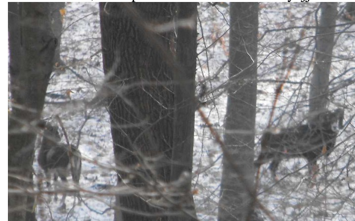
Óvatosságuk az emberrel szemben érthető

A nyomokat követve hamarosan találkozunk az erdőlakókkal, mint például ezzel a muflon nyájjal