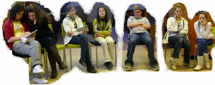
Leültek a meglepetéstől ☺

Extra jutalmuk pedig, hogy meghívást kaptak a bakonyi extrém táborba, a „nagyok” közé, egy komoly feladatra