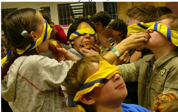
Ennyire szeretik a fánkot