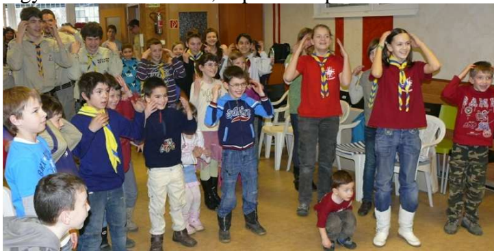
Fejem, vállam, térdem, talpam...