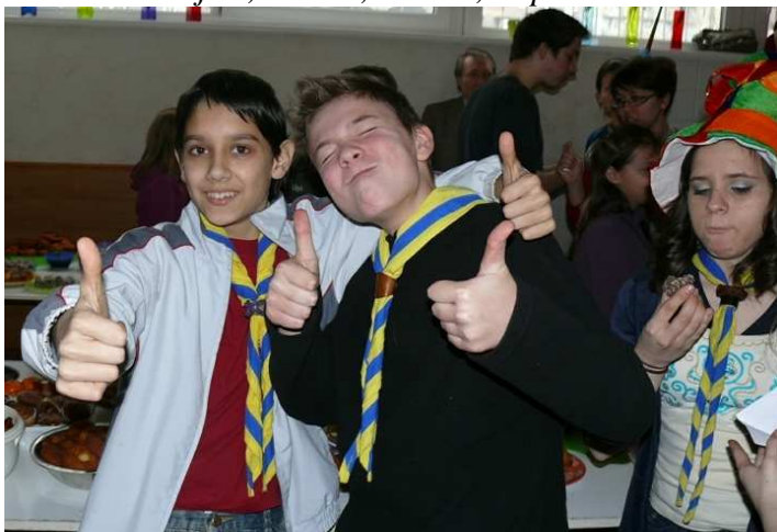
Az jó, ha már a fiúk is így gondolják

Négy ranger törzs hét csoportja mérte össze ügyességét a különféle próbákban és játékos feladatokban. A nap végére a „hétpróbás” ranger csoportokból a Pestlőrinci lányok, az Égi lovagok jöttek ki győztesen.